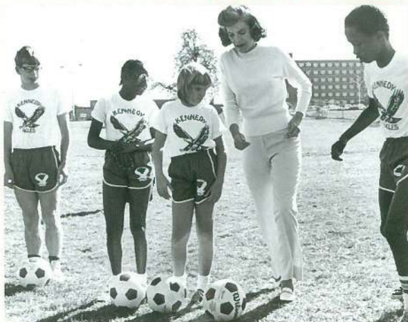
ユニス・ケネディ・シュライバー夫人

1962年、故ケネディ大統領の妹ユニス・シュライバーは、当時スポーツを楽しむ機会がなかった知的障がいのある人たちにスポーツを通じ社会参加を応援する「スペシャルオリンピックス」を設立。